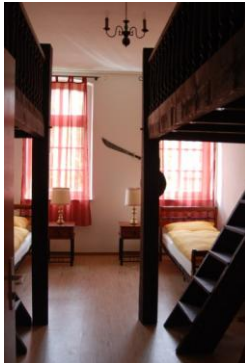
Black Pearl (Marion)

Hier eine kleine Auswahl der insgesamt 18 Zimmer, die nach ihren Paten aus der Gemeinschaft benannt wurden: